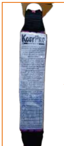
CAPUCHÓN PROTECTOR DE DENIM IGNIFUGO PARA EL ABSORBEDOR

LÍNEA DE VIDA Y CONEXIÓN CON ABSORBEDOR DE IMPACTO DE 1.80m LÍNEA DE CABLE CON GANCHOS DE 2 1/2"