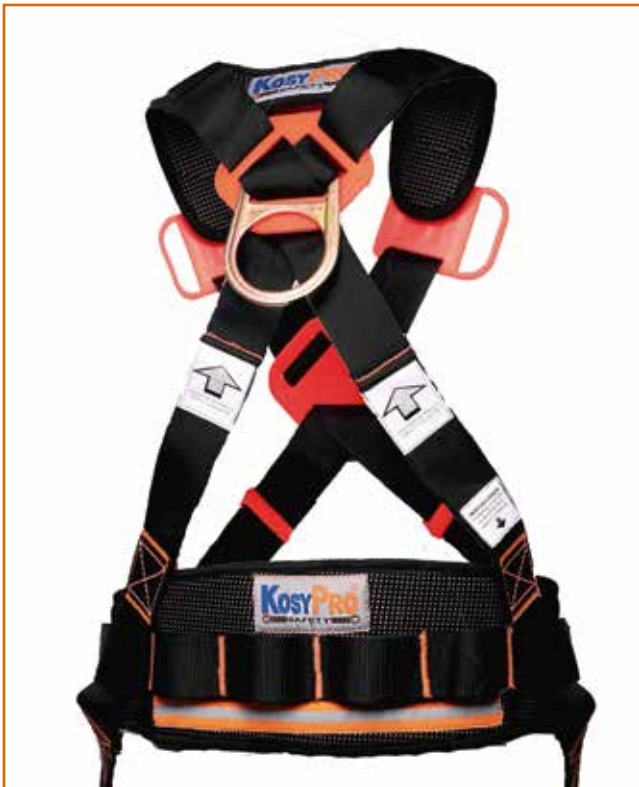
VISTA ANILLA POSTERIOR y CINTURON