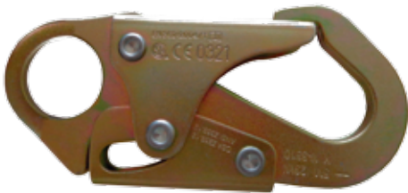
GANCHO PEQUEÑO DE 3/4" DE APERTURA DE PUERTA RESISTENCIA DE COMPUERTA DE 3600 lbs