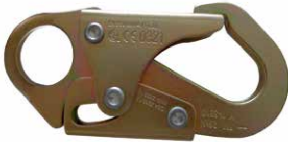
GANCHO PEQUEÑO DE 3/4" DE APERTURA DE COMPUERTA, RESISTENCIA DE COMPUERTA DE 3600 lbs