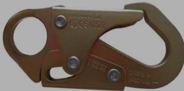
GANCHO PEQUEÑO DE 3/4" DE APERTURA DE COMPUERTA, RESISTENCIA DE COMPUERTA DE 3600 lbs

Absorbedor de Impacto de 6 pies = 1.80m Conexión a la altura de la cabeza