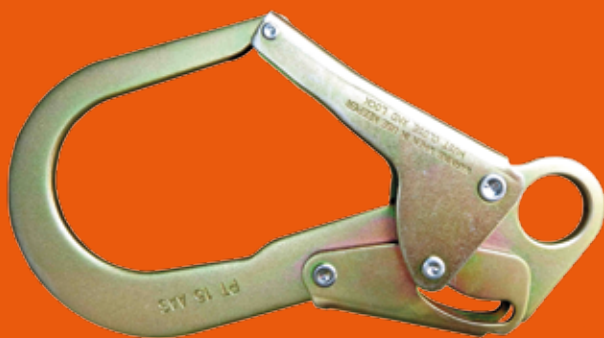
GANCHO PEQUEÑO DE 2 1/2" DE APERTURA DE PUERTA RESISTENCIA DE COMPUERTA DE 3600 lbs